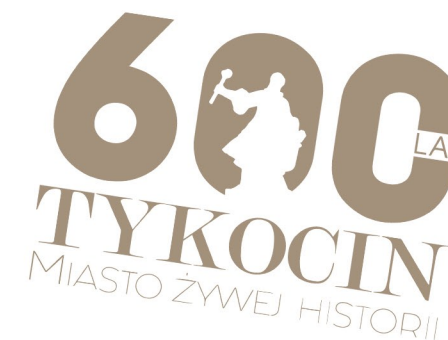
stosowanie kąta odchylenia