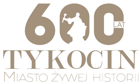
zmiana poszczególnych elementów